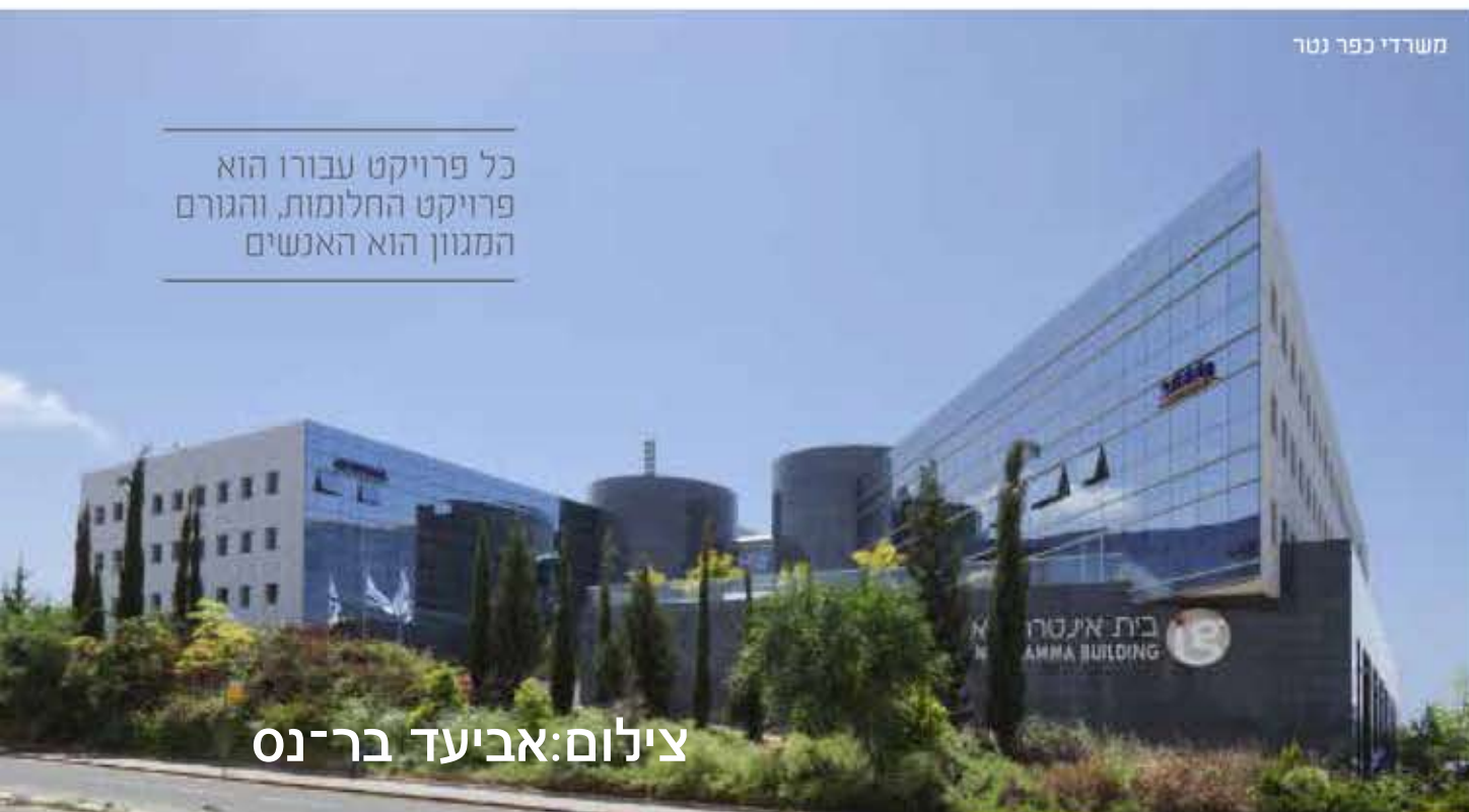
משרדי כפר נטר

כל פרויקט עבורו הוא פרויקט החלומות, והגורם המגוון הוא האנשים